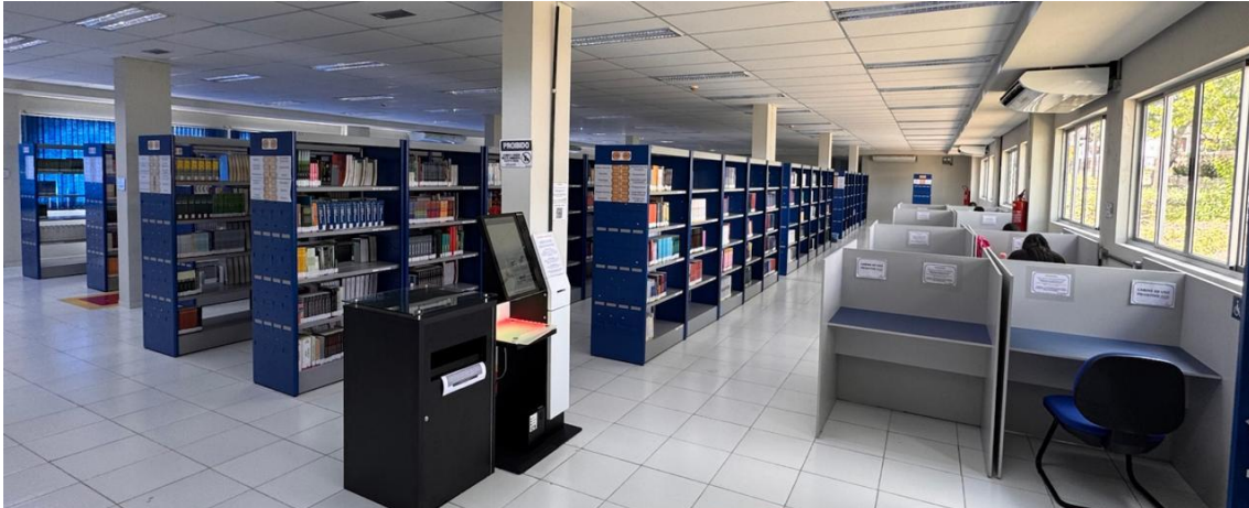
Figura 3: Sala de acervo da Biblioteca do SIB/UFAPE

O novo espaço da biblioteca foi inaugurado com cabines individuais de estudo, equipamento de autoatendimento, sala de estudo coletivo, espaço de informática, sala de vídeo, entre outros. Com essa nova estrutura, a comunidade acadêmica dispõe de um ambiente equipado de convivência e de apoio ao ensino, pesquisa, extensão e cultura.