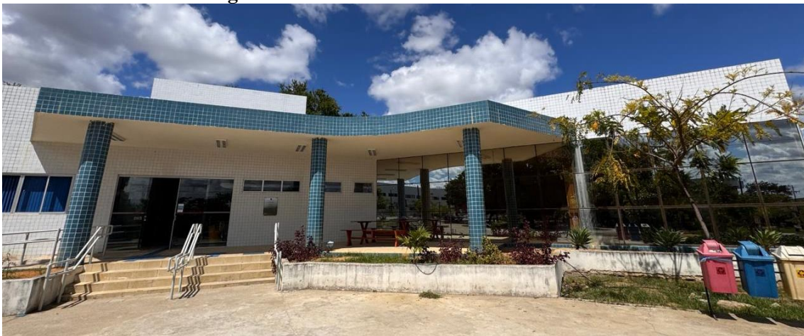
Figura 2: Prédio da Biblioteca do SIB/UFAPE

Em 26 de março de 2024, o novo prédio da biblioteca central foi entregue à Universidade pela construtora, data que houve uma solenidade de entrega com a participação do Reitor, Prefeito Universitário, Direção do Sistema Integrado de Bibliotecas e Diretor da construtora. No dia 8 de julho de 2024, a biblioteca abriu ao público na nova instalação.