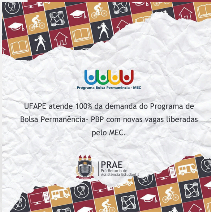
Card de divulgação da PRAE sobre o atendimento do PBP