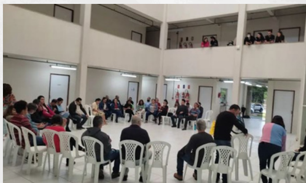
27ª Assembleia do SindUFape.

Na 27ª Assembleia da SindUFape, realizada na tarde do dia 20/06, os professores da Universidade Federal do Agreste de Pernambuco deliberaram pelo encerramento da greve da categoria docente. A data estipulada para o retorno das atividades é 1º de julho.