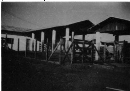
Figura 1 – Instalações de uma bovinocultura de leite