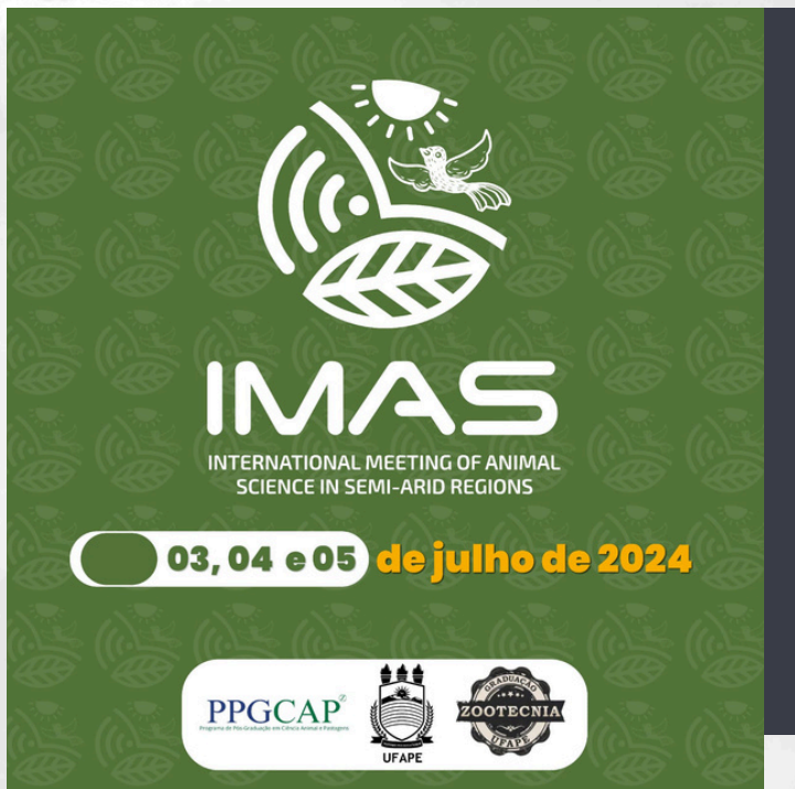
Card de divulgação do evento