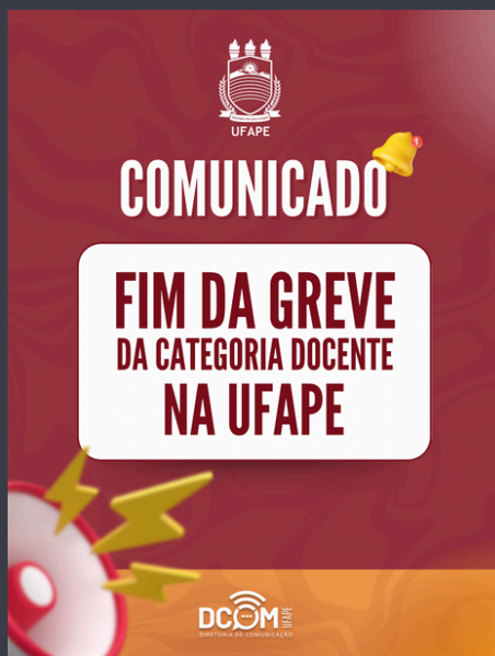
Card do comunicado do encerramento da greve